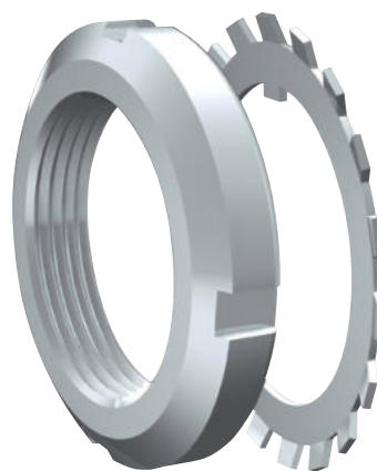
Porcas e Arruelas em Aço Inoxidável

Para qualquer item não listado no nosso catálogo, favor entrar em contato com nossa equipe de vendas