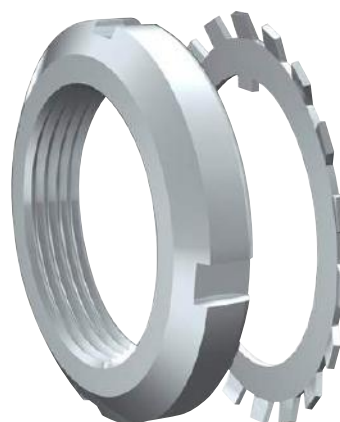
Porcas e Arruelas em Aço Inoxidável

Para qualquer item não listado no nosso catálogo, favor entrar em contato com nossa equipe de vendas